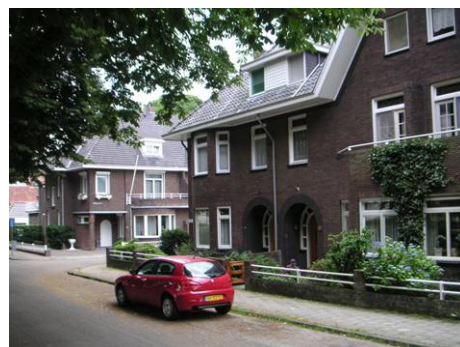
Hoek Observantenstraat - Minderbroederslaan