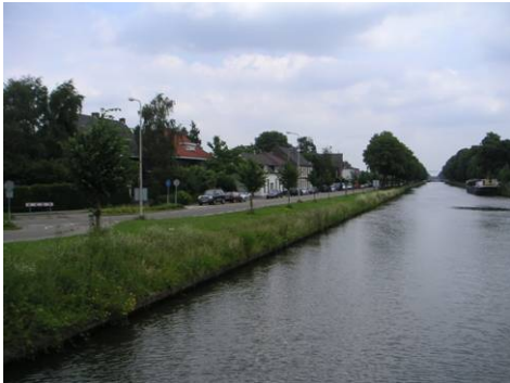
Noordkade vanaf Stadsbrug