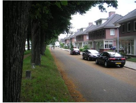
Niveaunderschil tussen pad en straat