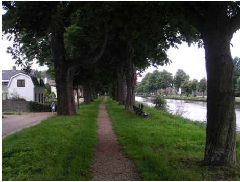
Verliefdenlaantje gezien vanaf Biesterbrug