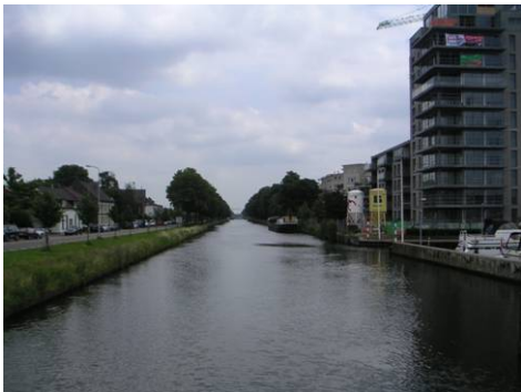
Zuid-Willemsvaart vanaf de Stadsbrug