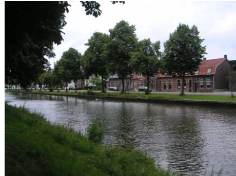
Noordkade vanaf Verliefdenlaantje