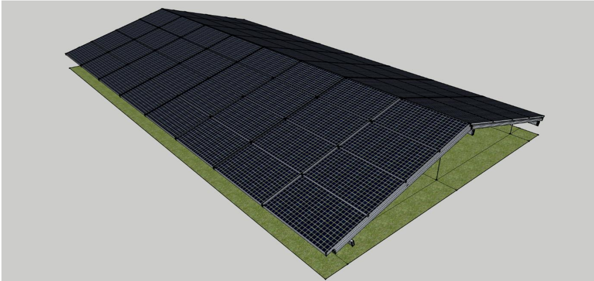
Figuur 2 : Bevestiging van de panelen op de draagstructuur

De draagstructuur is gemaakt uit staal. De zonnepanelen kunnen op verschillende manieren aan de structuur worden bevestigd (bouten, kliksystemen, etc.), afhankelijk van de keuze van de klant (bv beveiliging tegen diefstal).